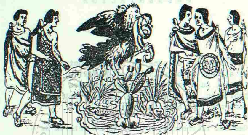
El óguila y la serpiente