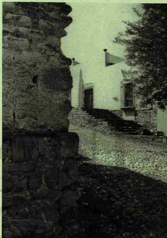
Villa de Santiago, N.L.

* Historiador, Cronista y Promotor Cultural.